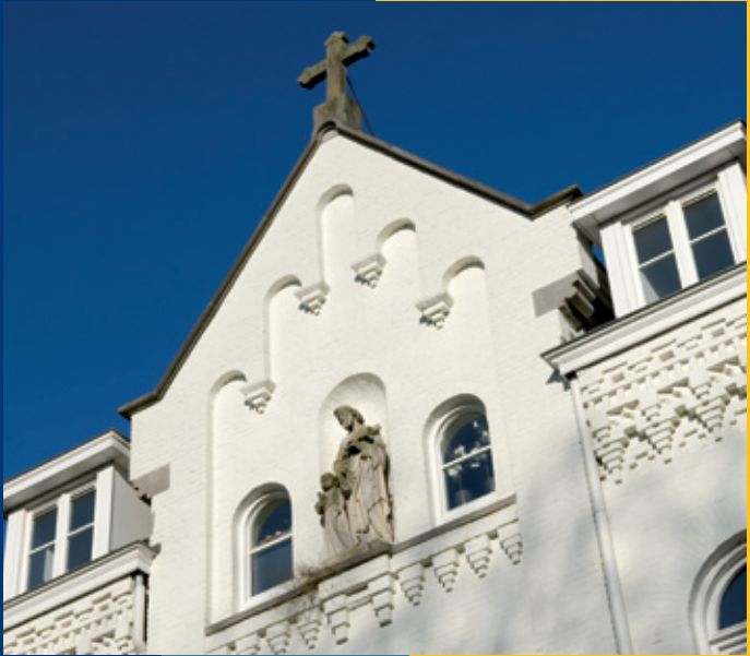
De Kloostertuynen in Orthen