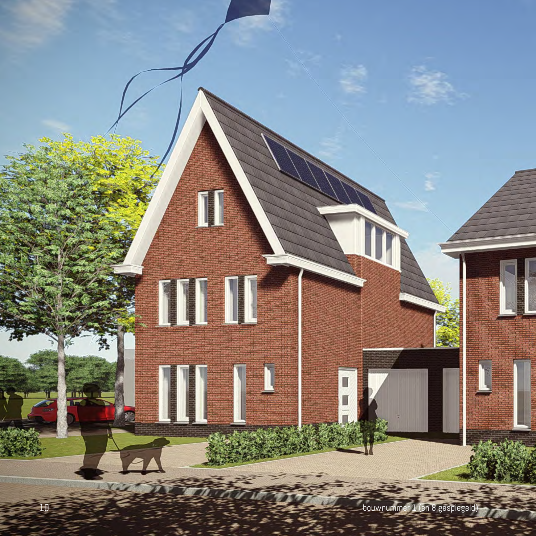
bouwnummer 1 (en 8 gespiegeld)