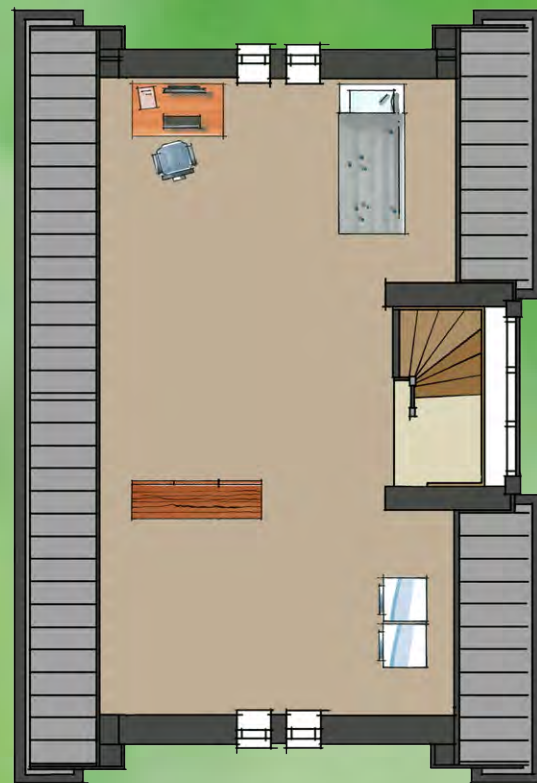
bouwnummer 1 (en 8 gespiegeld)

In deze plattegronden zijn meerwerkopties verwerkt.