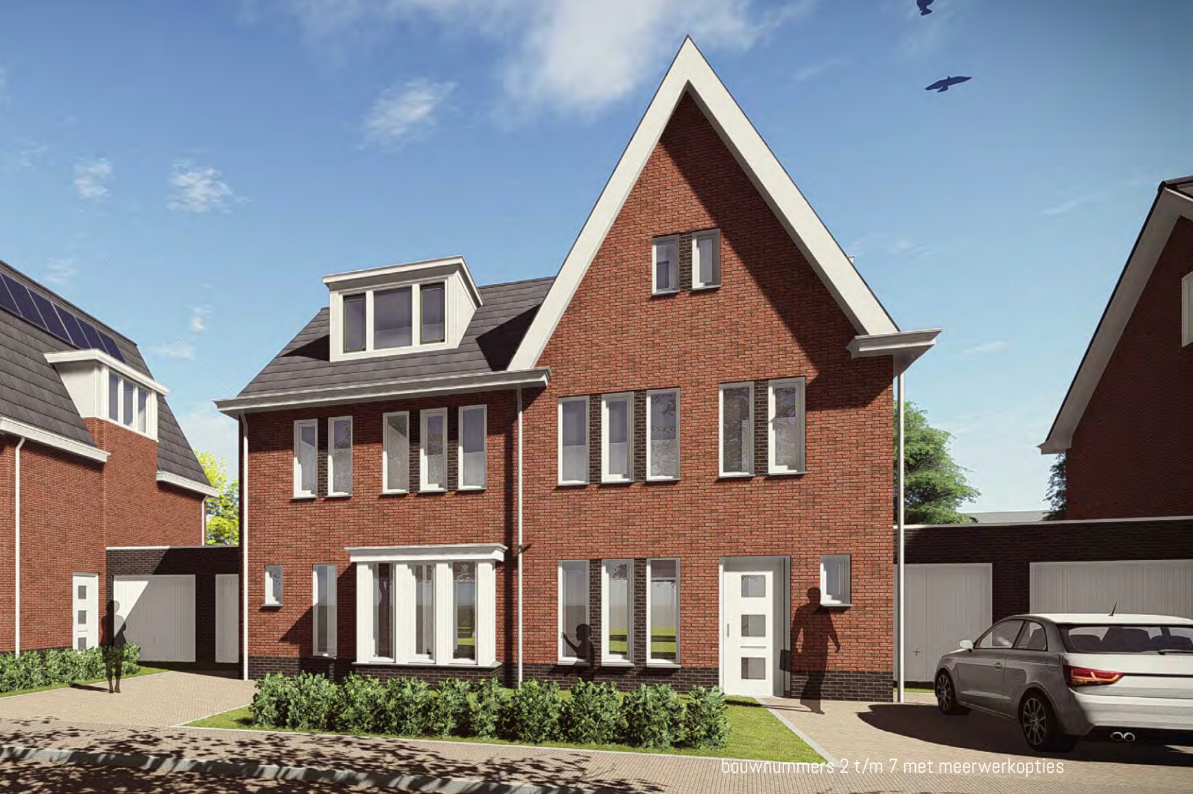
bouwnummers 2 t/m 7 met meerwerkopties