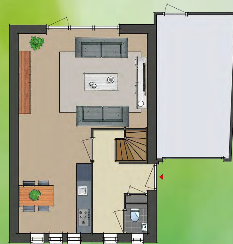
bouwnummer 1 (en 8 gespiegeld)

In deze plattegrond zijn meerwerkopties verwerkt.